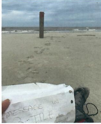
Met dank aan WW Terschelling voor alle ondersteuning

Het lijkt vandaag zó erg op toen dat ik het bijna niet geloof – de dag van de foto, knalblauwe lucht met felwitte vegen. Het koude water dat bijt en verfrist, het knijpen tegen de zon. Als ik mijn arm uitstrekt tast ik zo door een laag in de tijd. Je bent er gewoon.